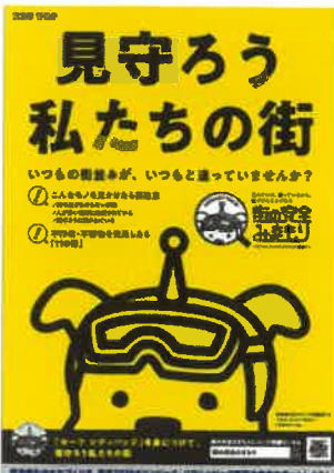
<ながら見守りステッカー>

私たちは、地域の見守りの目となり、日常業務をしながら子供や高齢者等の弱者を見守ってもらう「ながら見守り連携事業」に取り組んでいます。